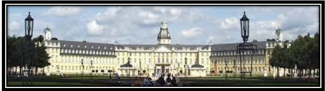
Das Schloss Versailles von König Ludwig XIV

Aufritten des Fürsten, von Hoffesten, Opernaufführungen, Theaterstücken, Bällen und Empfängen. Versailles bei Paris, Schönbrunn in Wien, Nymphenburg in München